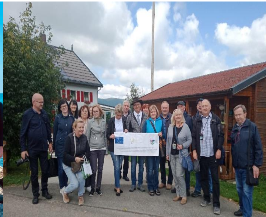
Wyjazd studyjny do Szwajcarii, KSOW, 2021 r.