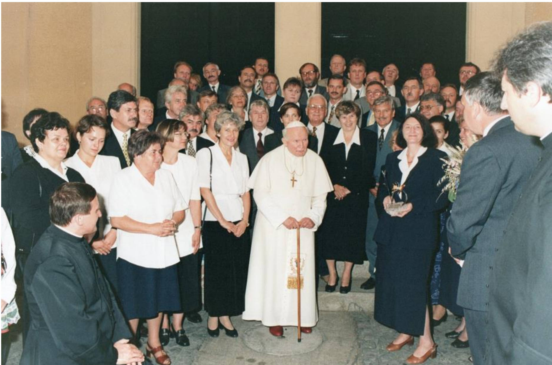
Doradcy ODR i pracownicy naukowi katedr doradztwa rolniczego uczelni rolniczych z Polski z wizytą u Papieża Jana Pawła II . Castel Gandolfo, 1998 r.