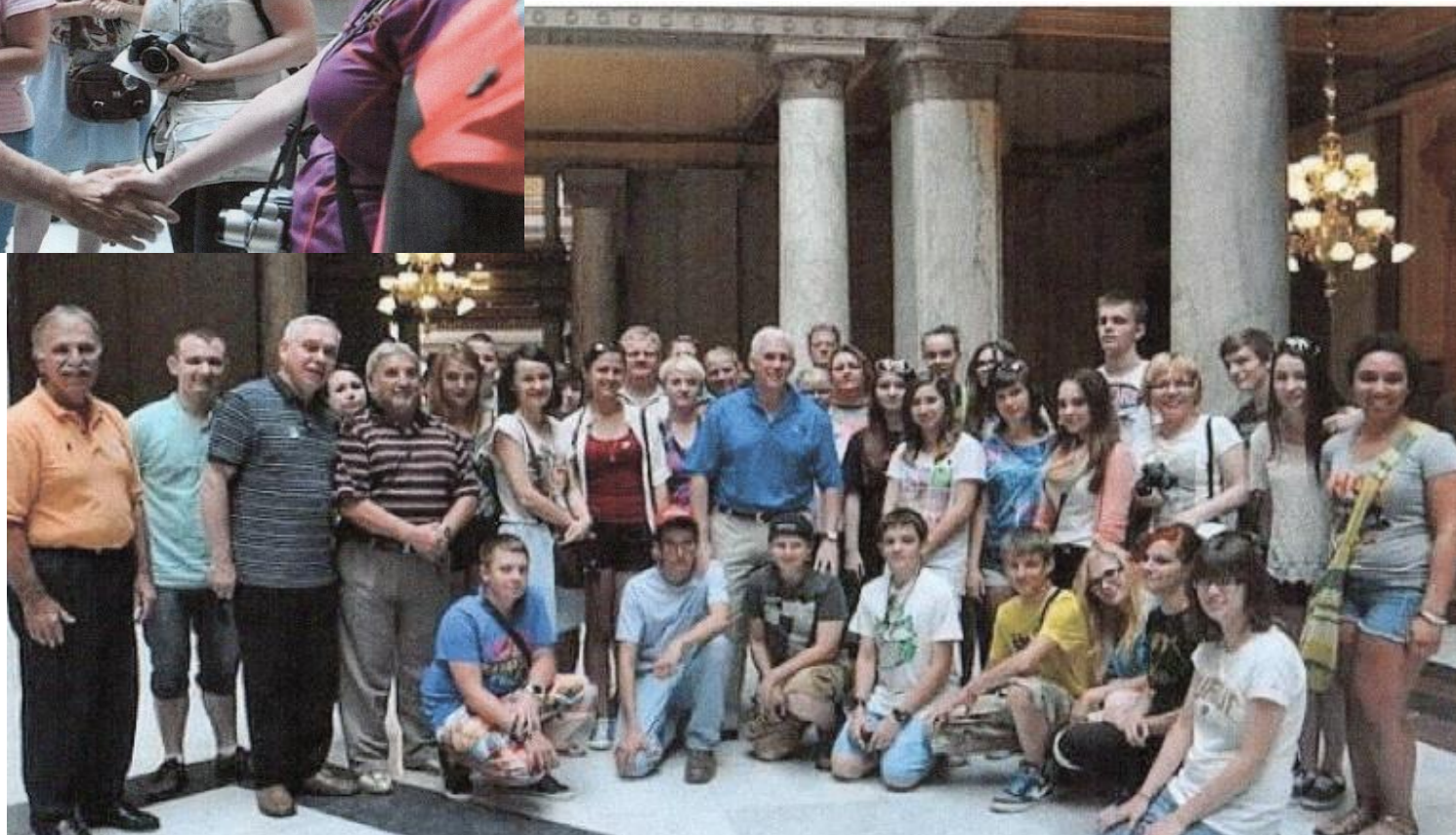
Młodzież z klubów 4H z woj. świętokrzyskiego i opolskiego z wizytą u Gubernatora Stanu Indiana Mike Pence (wiceprezydent USA 2017-2021), 2015 r.