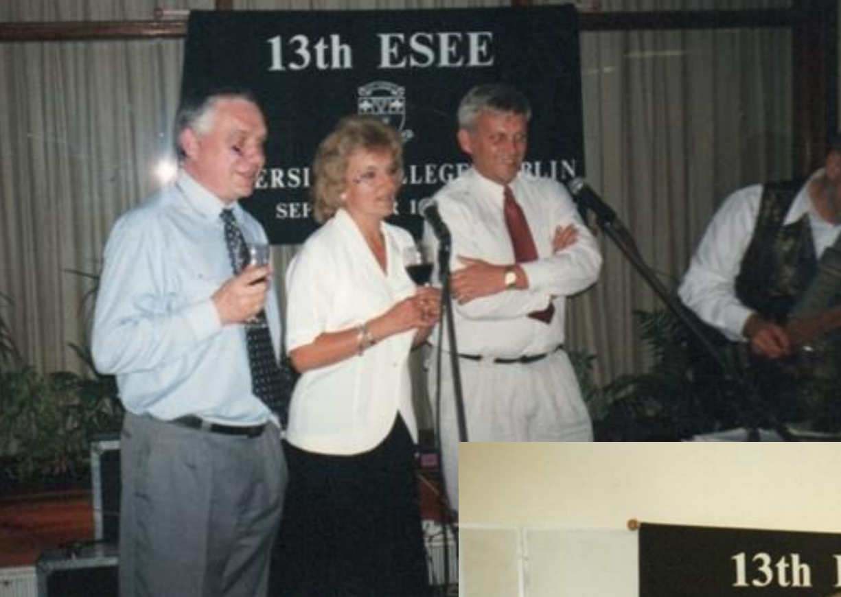
XIII Europejskie Symposium Doradztwa Rolniczego w Uniwersytecie w Dublinie, 1997 r.