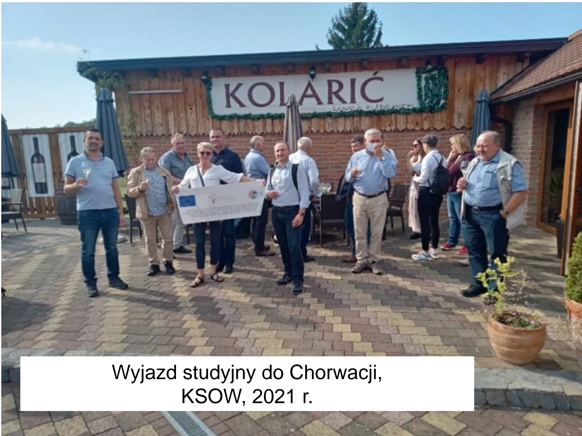
Wyjazd studyjny do Chorwacji, KSOW, 2021 r.