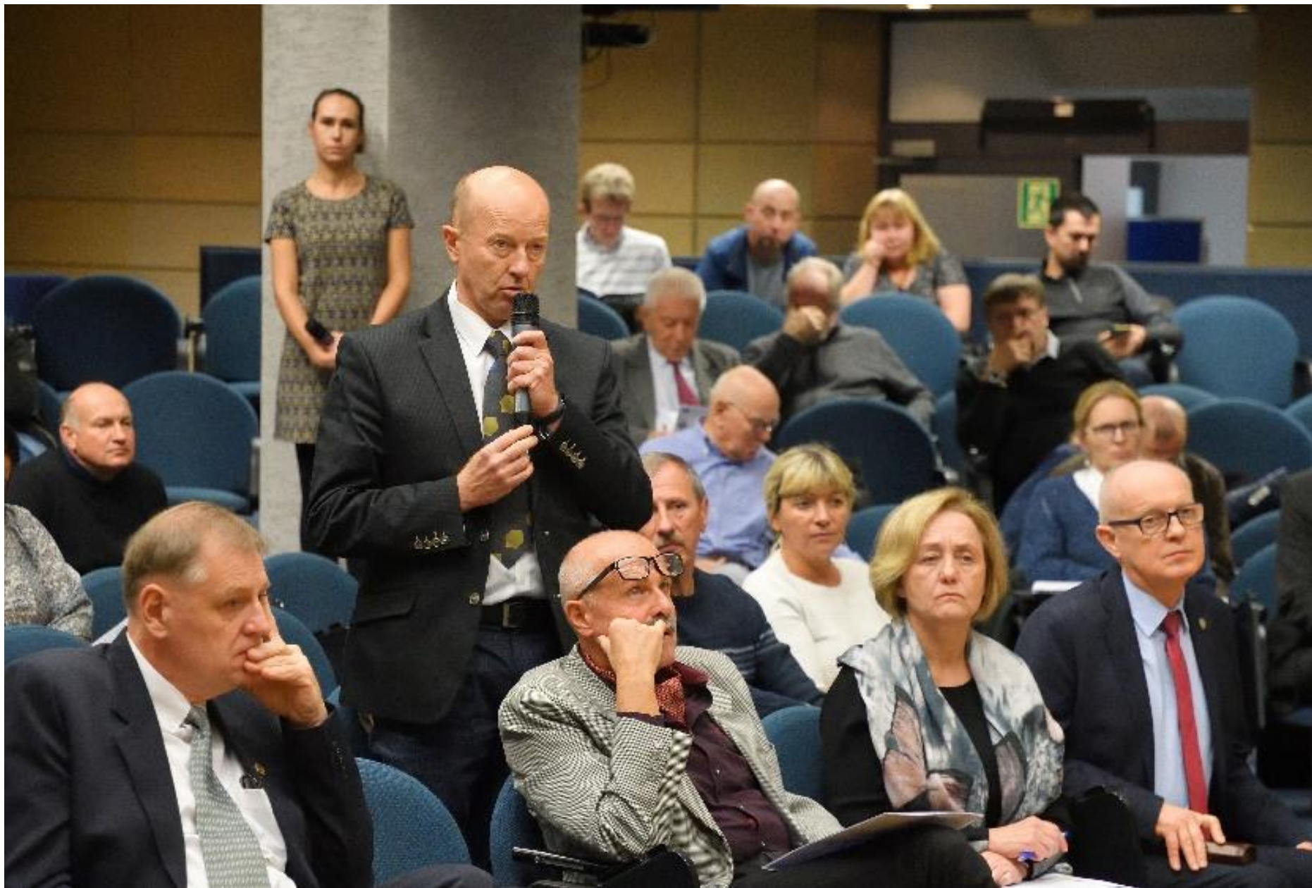
Konferencja pt. "Nasze Pszczoły", 2019 r.