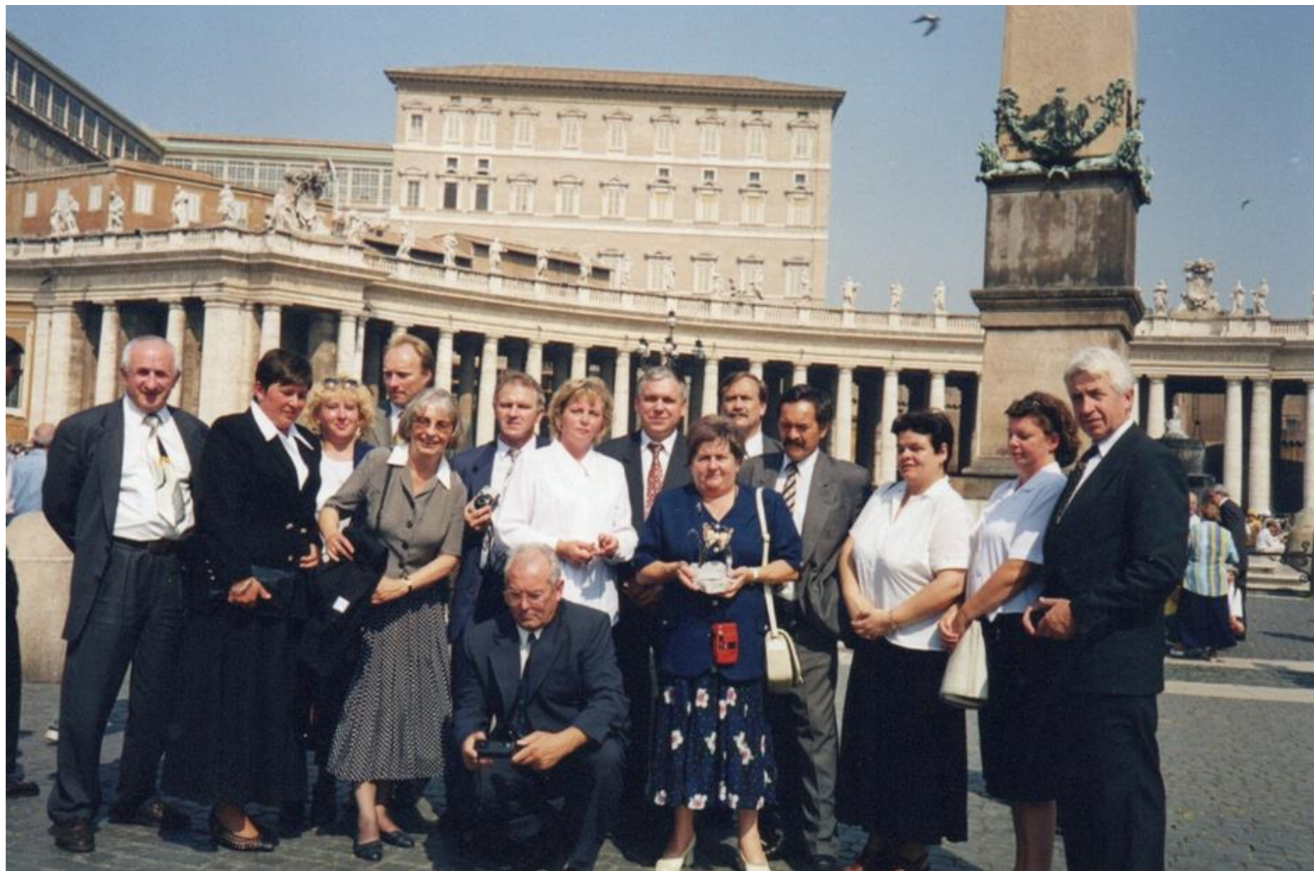
Doradcy ODR i pracownicy naukowi katedr doradztwa rolniczego uczelni rolniczych z Polski na Placu Św. Piotra. Rzym, 1998 r.