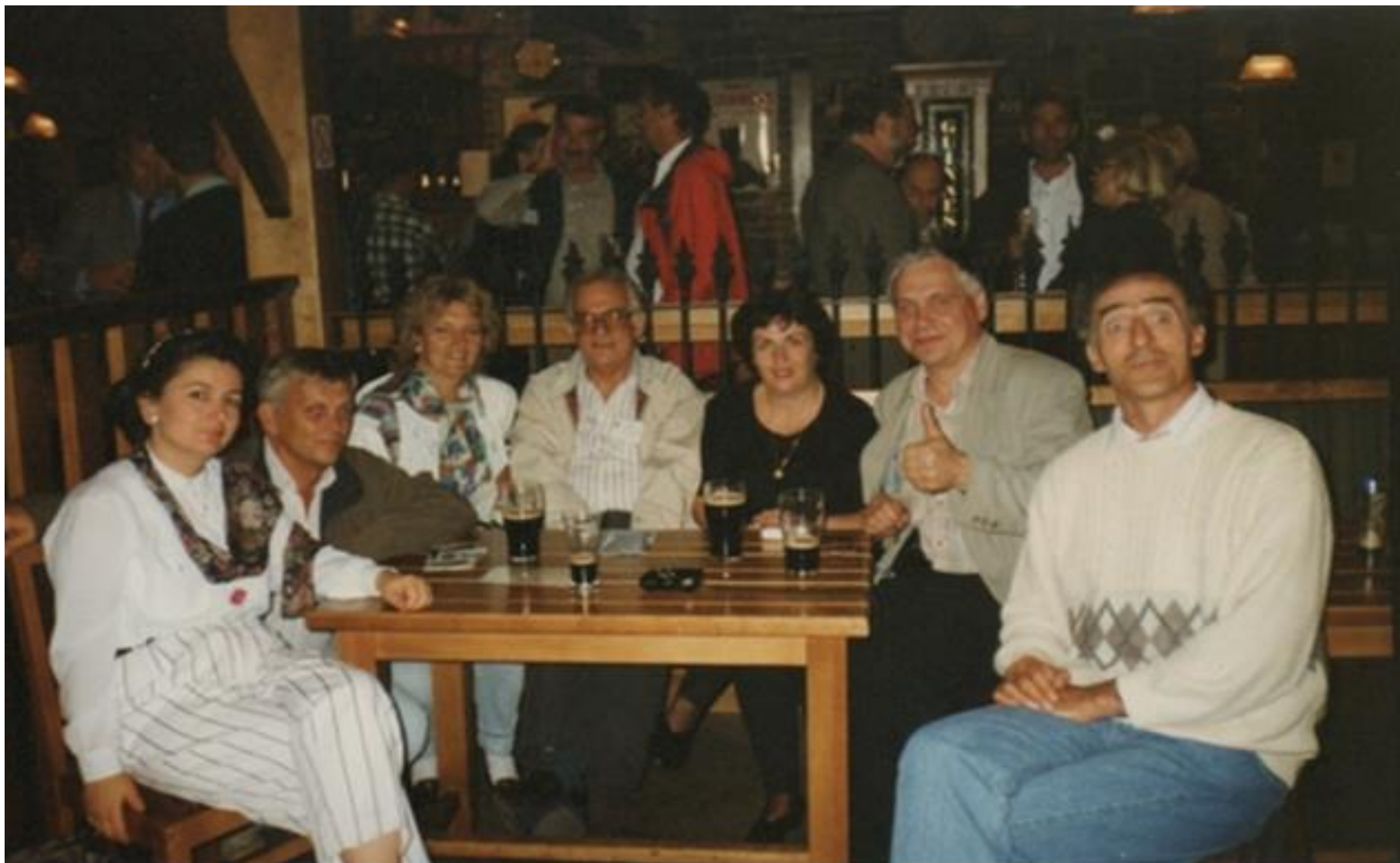
XIII Europejskiego Sympozjum Doradztwa Rolniczego w Uniwersytecie w Dublinie, 1997 r.