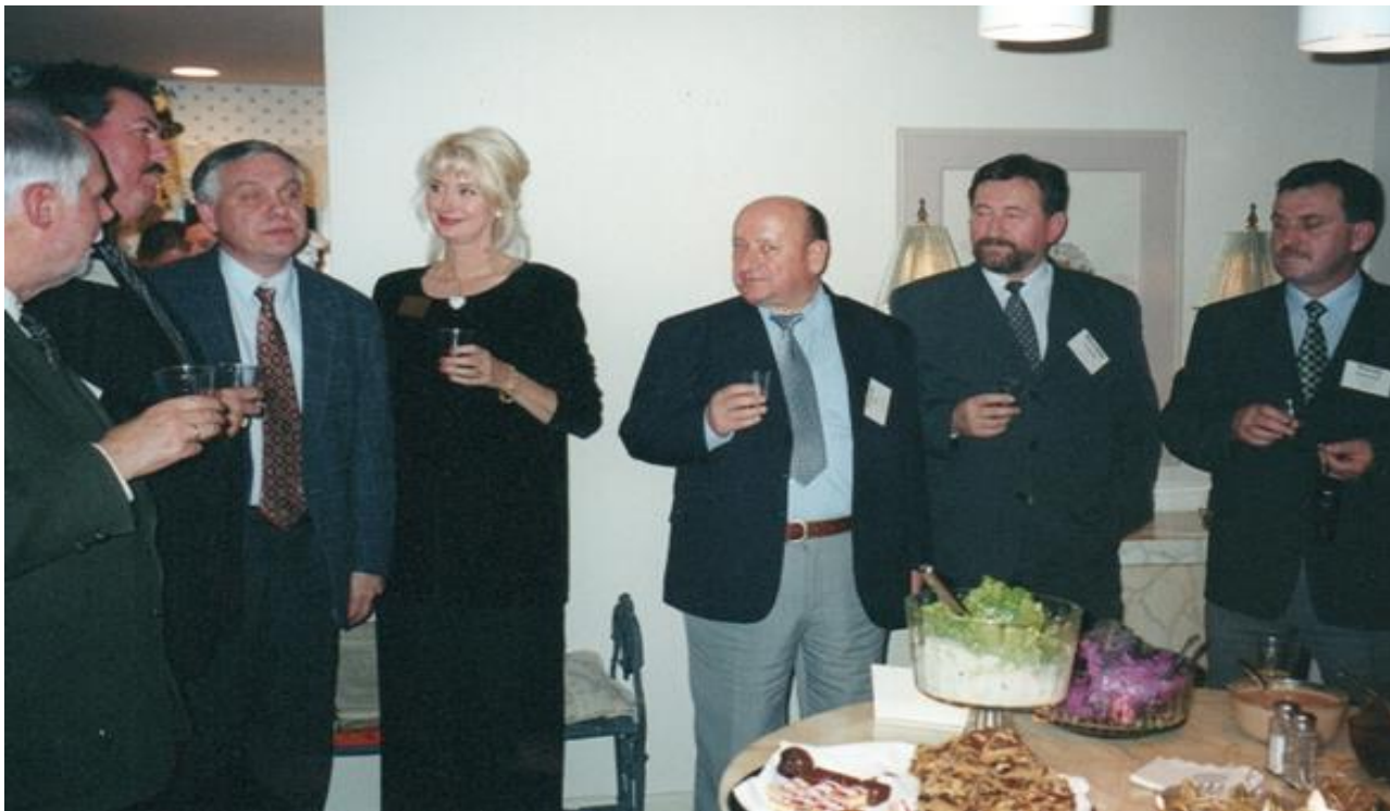
Uczestnicy kursu "Zarządzanie firmą nasienną"