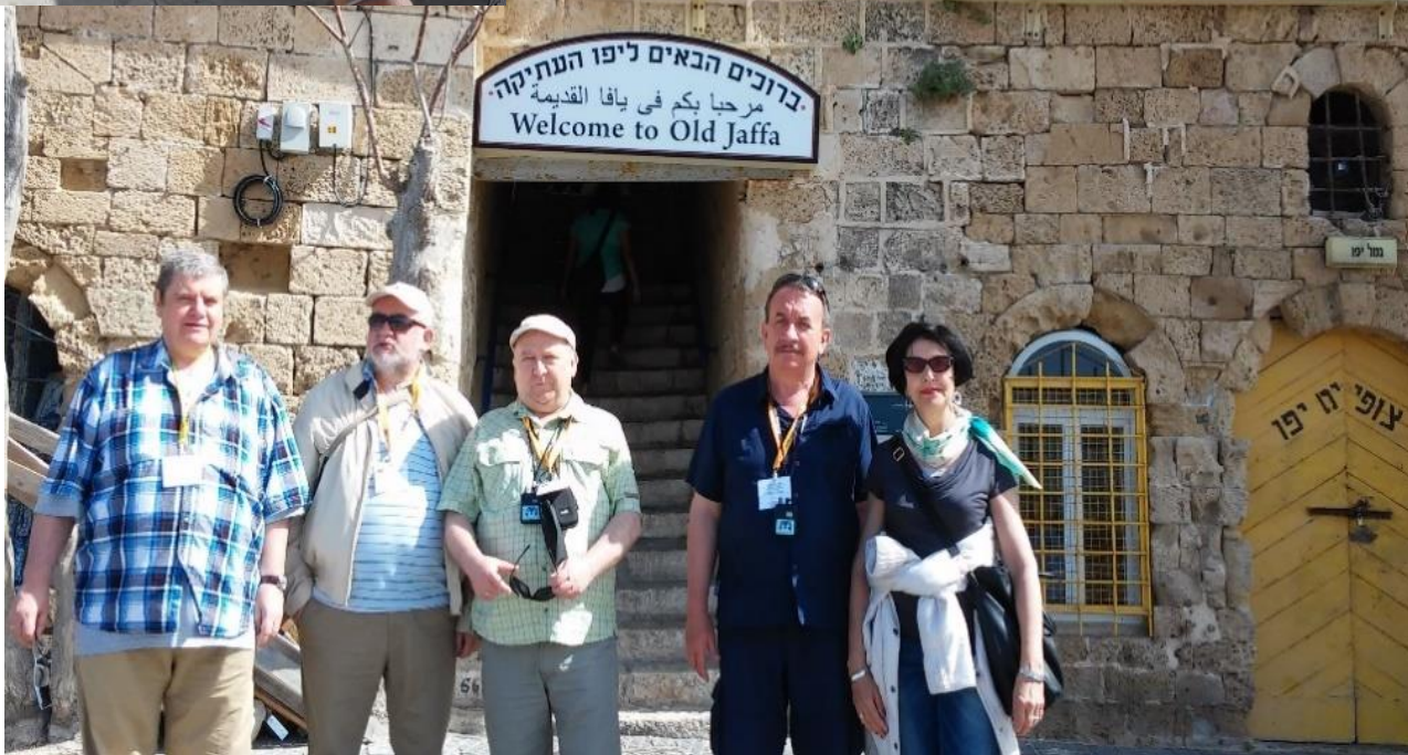
MSDR i MIR z wizytą studyjną w Izraelu, 2015 r.