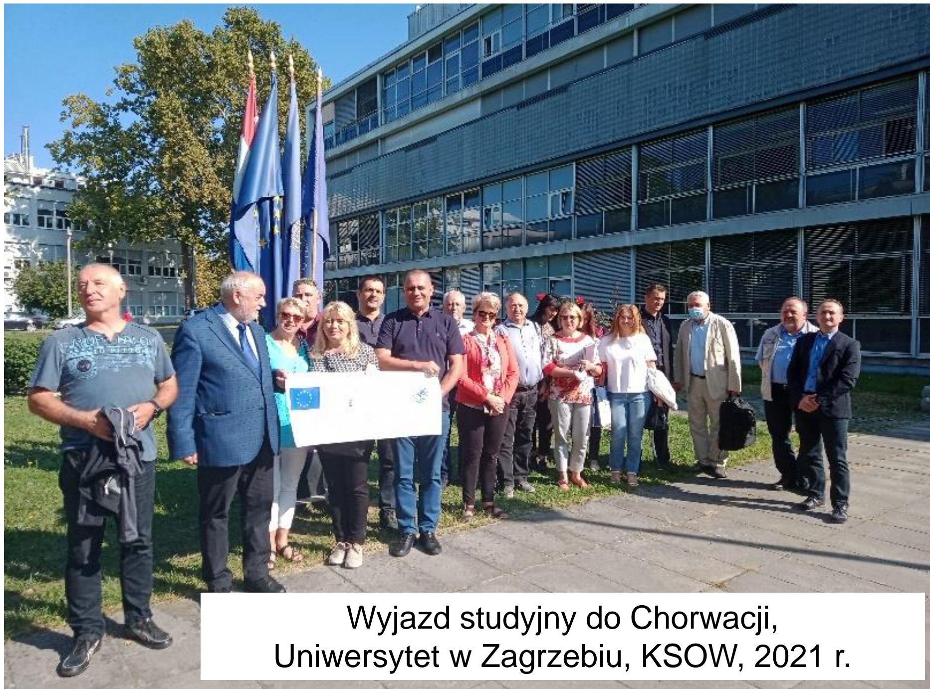
Wyjazd studyjny do Chorwacji, Uniwersytet w Zagrzebiu, KSOW, 2021 r.