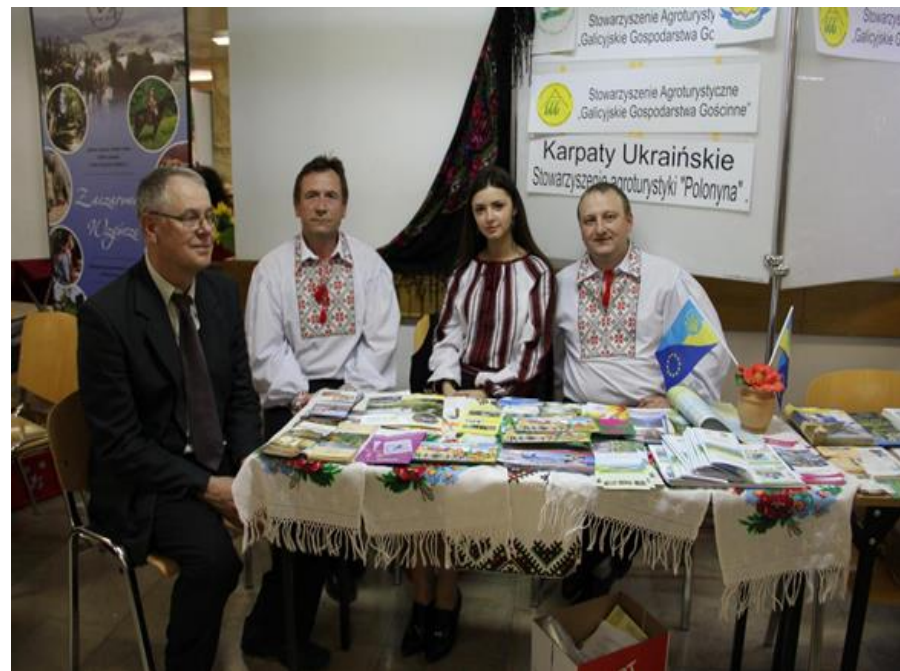
Małopolska Giełda Agroturystyczna, 2015 r.