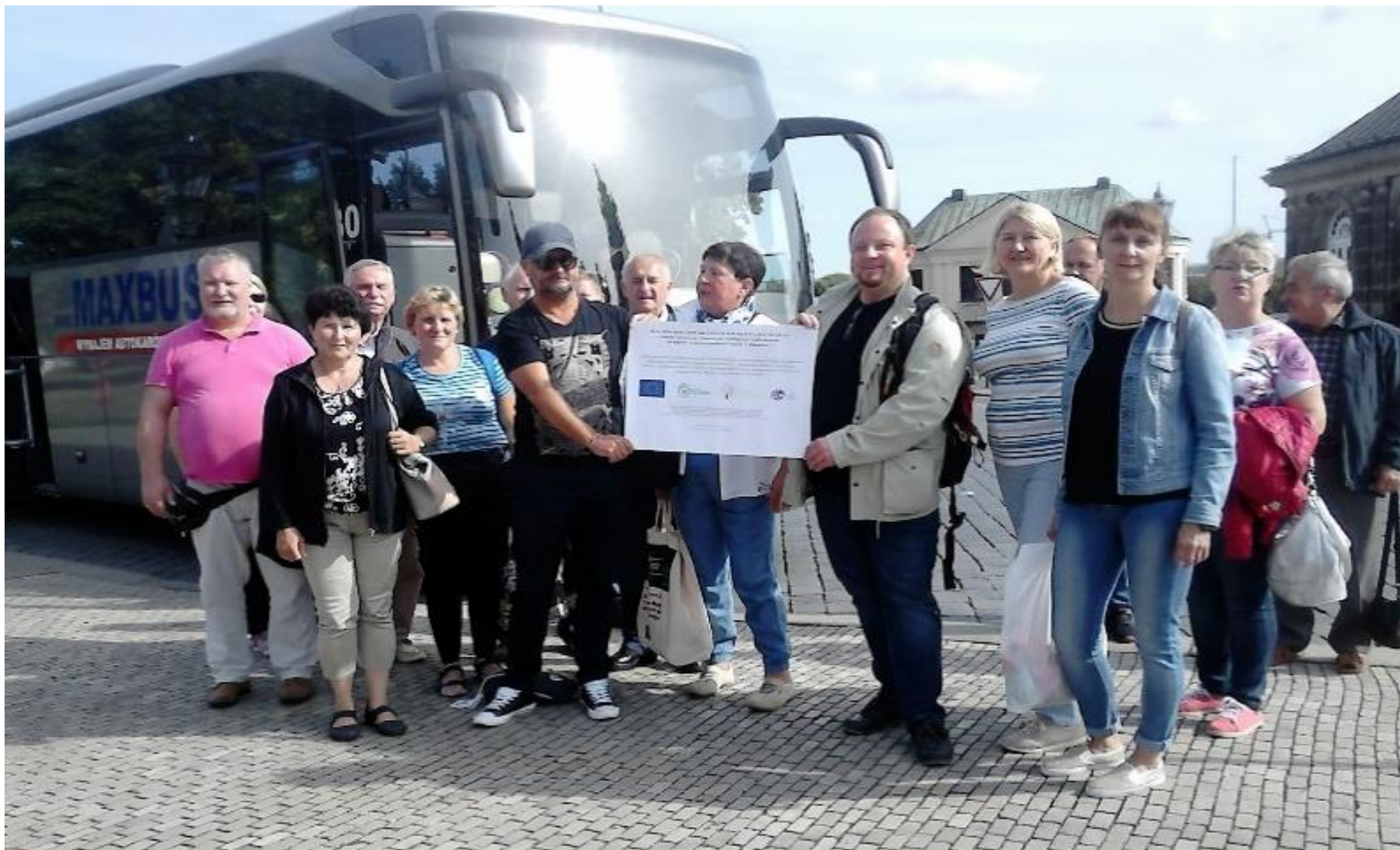
Wyjazd studyjny do Niemiec i Luksemburga, SIR, 2019 r.