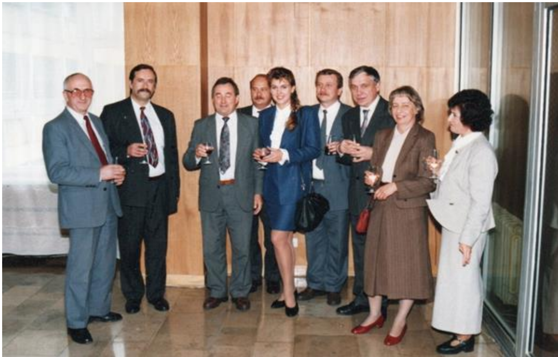
Uczestnicy seminarium MSDR z Miss Polonia z 1992 r., AR w Krakowie, 1995 r.