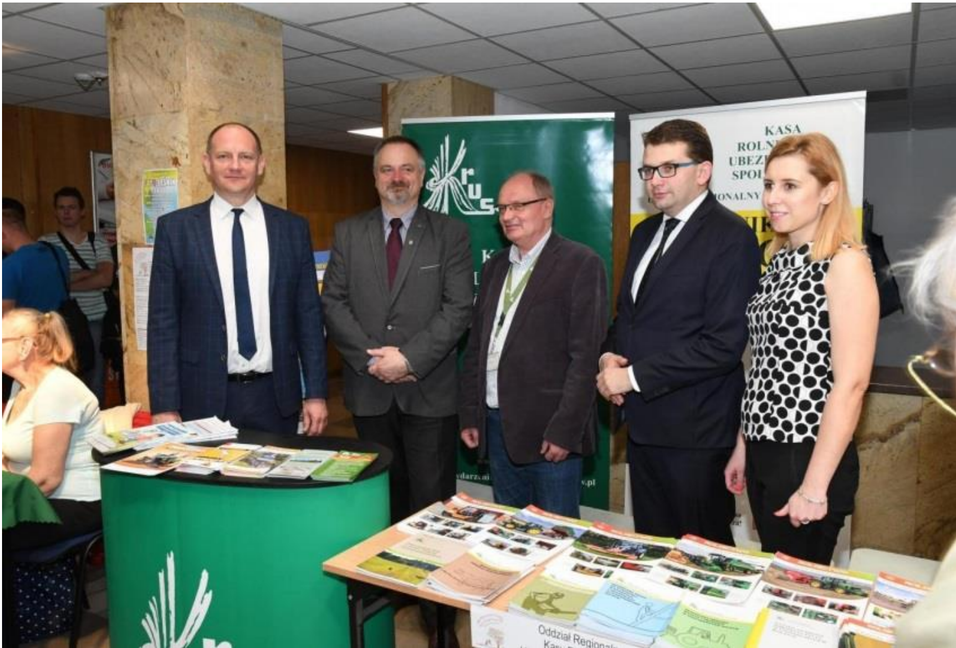
Małopolska Giełda Agroturystyczna, 2023 r.